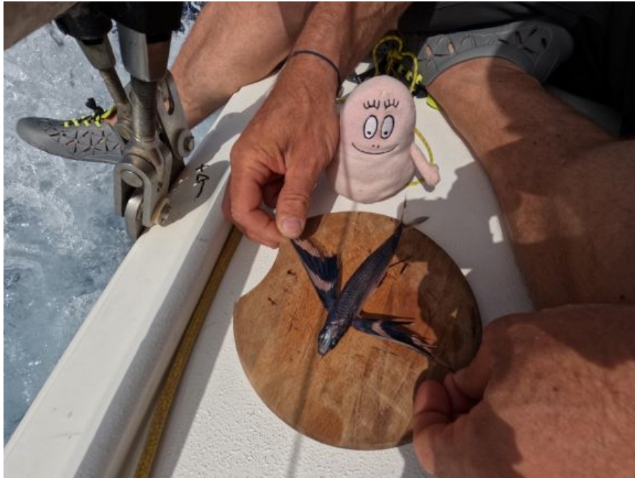
Découverte du poisson volant pour Barbarama