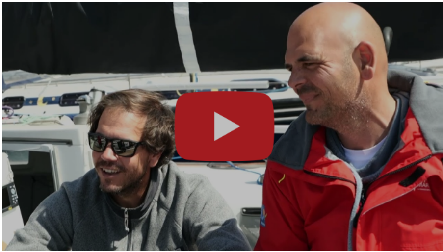
Derniers préparatifs avant le départ